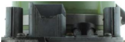
Elektrischer Anschluss-Stecker gebrochen