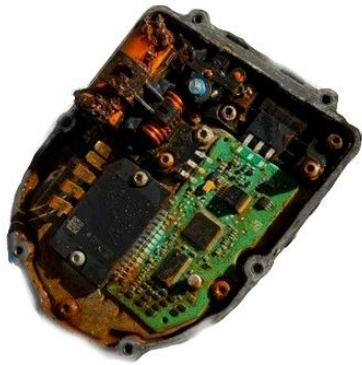
Wassereintritt in der Elektronik